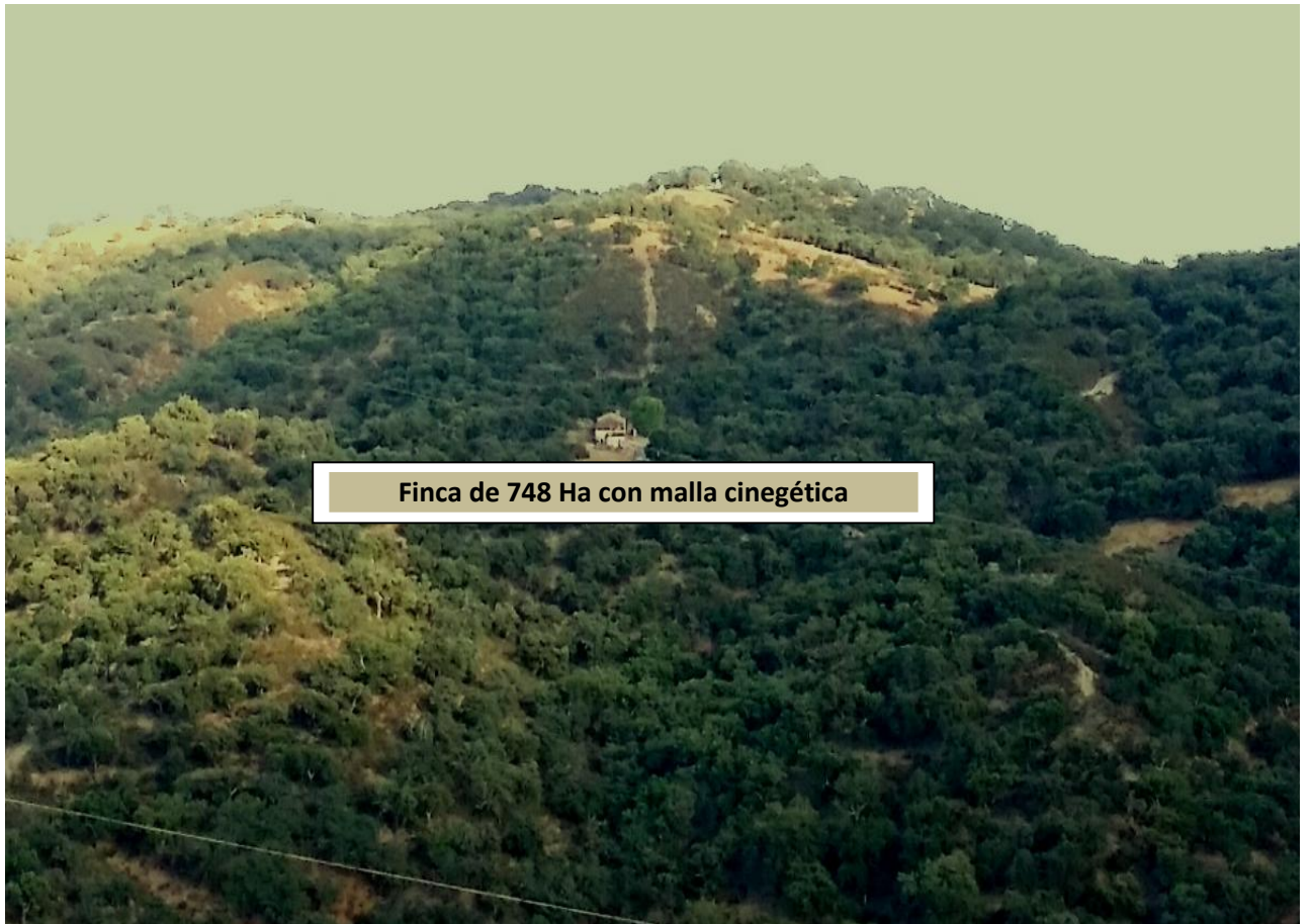
Finca de 748 Ha con malla cinegética

El mimo con el que la propiedad cuida este coto desde hace más de 40 años, le ha hecho ser una finca con muchísimo prestigio y solera en el mundo de la caza mayor, y muy especialmente en el ámbito de la montería española.